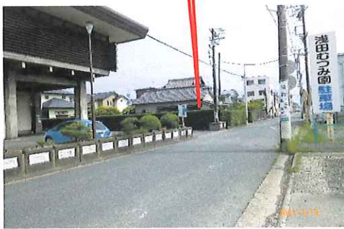
東側駐車場出入口